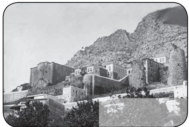
Սիսի Կաթողիկոսութեան համալիրը Բլուրին վրայ Սիսի միջնաբերը

Ահաւասիկ երկու դերակատարներ Սահակ Կաթողիկոս և Ճեմալ Փաշա, թերեւս այս երկուքին շնորհիւ Սուրբ Աթոռը փրկուեցաւ մեծ փորձանքներէ: