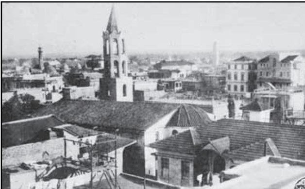
Պատմական Ատանա. հայկական քաղերը