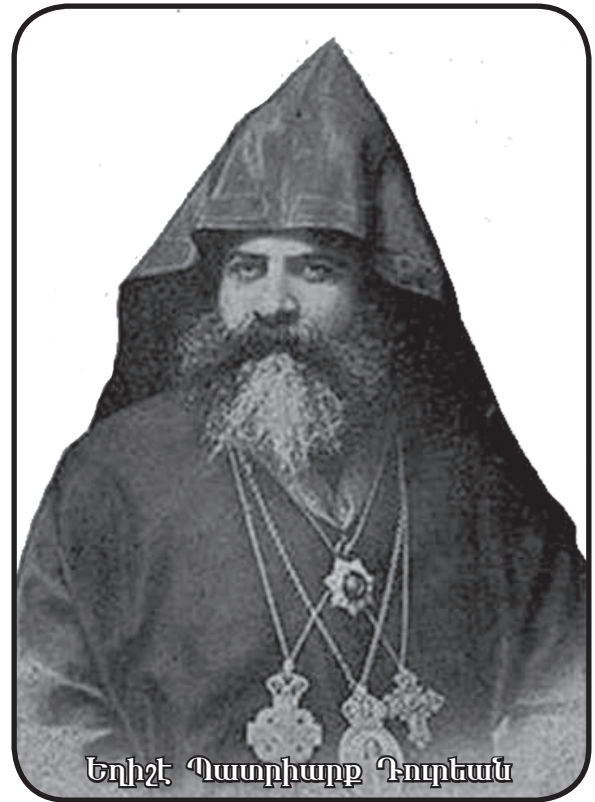
Եղիշէ Պատրիարք Դորեան

Հայկական Լեզեոն ըսուածը ֆրանսական դրօշակի ներքեւ կամաւորներու խումբ մ'է: Ասկէ առաջ ֆր[անսական] կառավարութեան և Լեզեոնի զինուորներու միջեւ անհամաձայնութեան պարագաներ յառաջ եկած էին, մասնաւորապէս այն պատճառով որ պէտք եղած չափով գոհացում չէր տրուեր Հայկական Լեզեոնի զինուորներուն, անոնցմէ պահանջուելով մանաւանդ Չինադադարէն յետոյ 2 տարուան անպայման զինուորագրութիւն, ինչ որ դժգոհութեան առիթ կ'ըլլար իրենց: Ասոնք հայրենիքին և իրենց ընտանիքին մեծ մասը կորսնցուցած՝ անոնց յիշատակովը միացող սրտեր էին, որոնք մօտ տեսնելով ազգին փրկութեան հնարաւորութիւնը, ինքզինքնին զոհած էին սպասուած փրկութեան լոյսը իրենց ձեռքովը վառելու յոյսերով: Բայց իրենց մէջ պզտիկ յուսախաբութիւն մը կար, որ արձագանգեց մինչեւ Փարիզի Պատուիրակութեան