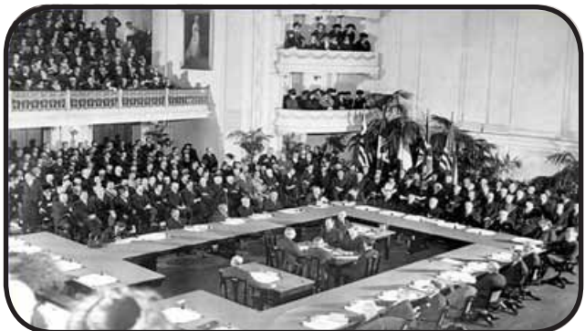
Փարիզի Խաղաղութեան Վեհաժողով Վերսայ, 1919

15. Ատանա հրատարակուած «Կիլիկիա» երկօրեայի 7 Մայիս 1919-ի 29-րդ համարով տեղեկատուութիւն մը մէջ, որ կը վերաբերի նախագահ Ուիլսըմի հետ Դուրեան Արք.ի հանդիպման, կը կարդանք թէ Նախագահ Ուիլսըմ յայտնաւորած է. «Ես անձնապէս շատ համակիր եմ հայ ժողովուրդին. իր իրաւունքն է անկախ ըլլալ: Աս ոչ միայն իմ տեսակէտս է, այլ նաեւ ամբողջ իմ ժողովուրդիս՝ որ այդ յանձնարարութիւնը ըրած է ինձի պաշտօնակալս. ես չեմ կրնար իմ ժողովուրդիս կամքին հակառակ գործել: Արդէն Խաղաղութեան Համաժողովին մէջ ալ ձեր կարծածէն շատ աւելի անկեղծ բարեկամներ ունիք, որոնք պիտի լուծեն հայկական հարցը հայ պահանջներուն համեմատ: Կը խնդրեմ որ հայ պատուիրակութիւնը արեւելեան հարցին առիթով կազմուած ամերիկեան յանձնախումբին հետ սերտ յարաբերութեան մէջ մնայ, որպէսզի յանձնախումբը առանց սխալելու կարենայ պէտք եղած ուժով պաշտպանել հայ ժողովուրդին ամբողջ իրաւունքը՝ Կիլիկիան հայ անկախ կառավարութեան թողուլ կարենալու և Սուրիոյ մաս չի կազմելու համար»: